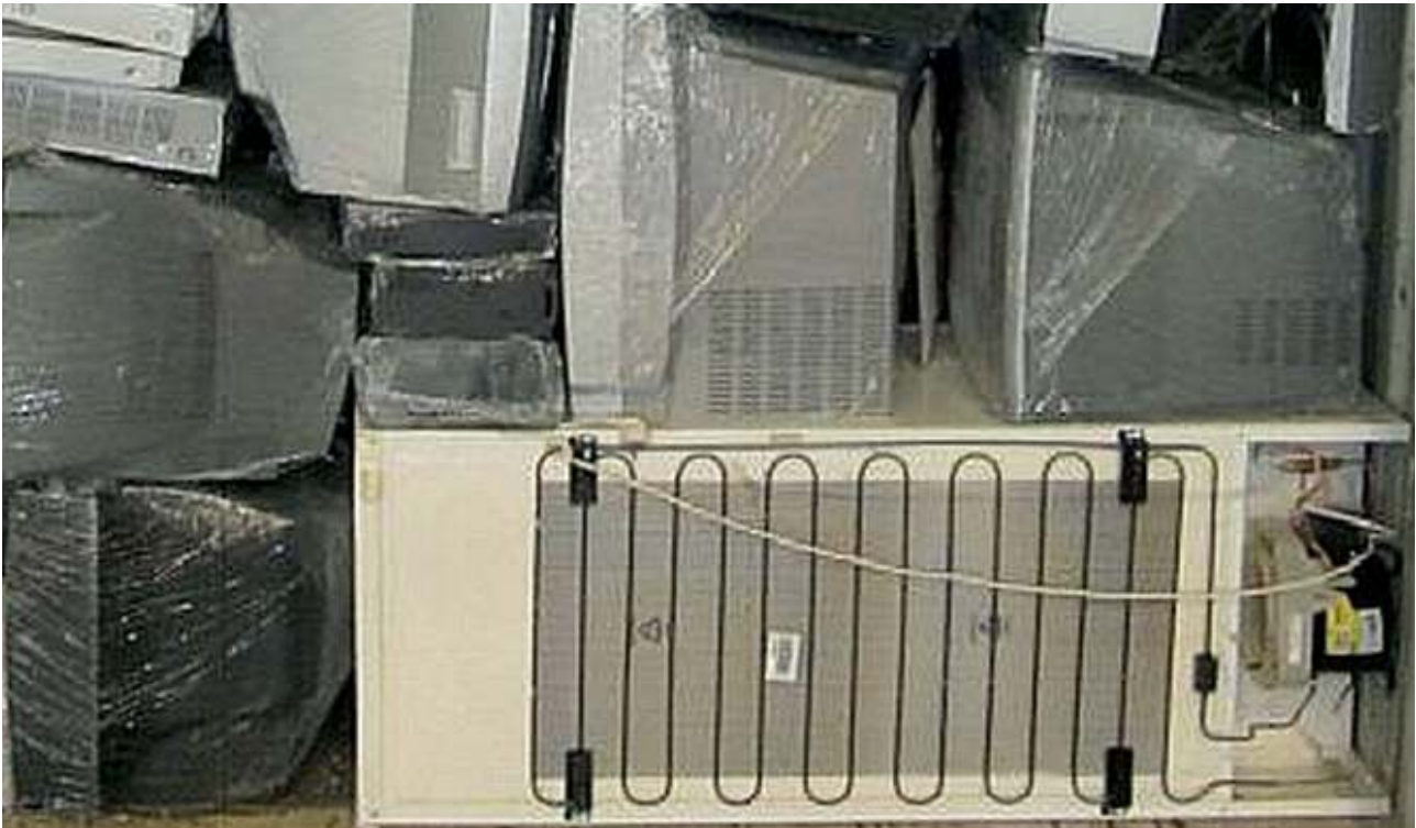
Gebrauchte Bildschirmgeräte und Kühlschrank mit unzureichender Verpackung, kein Testzertifikat - gefährliche Abfälle Used visual display units and refrigeration equipment with insufficient packaging, no certificate of testing - hazardous waste

In case of shipments of defective used EEE for route-cause analysis to non-EU Member States, it is recommended to provide a written statement by the competent environmental authority in the country of import (country of destination), confirming that those shipments are not subject to the waste legislation.