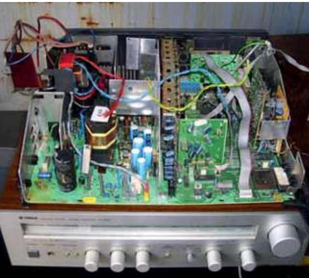
Altgerät und bestückte Leiterplatte - Abfall WEEE and populated printed circuit board - waste