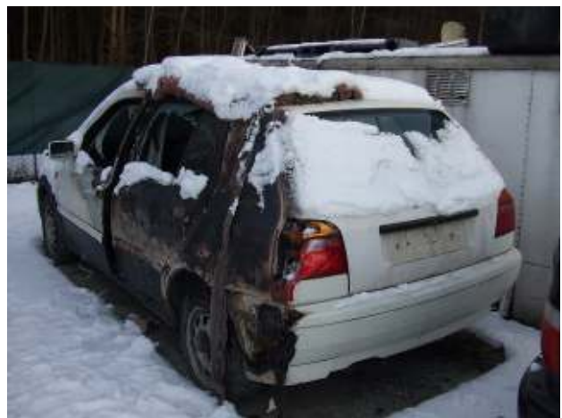
Altfahrzeug mit Brandschaden - gefährlicher Abfall Fire-damaged end-of-life vehicle - hazardous waste