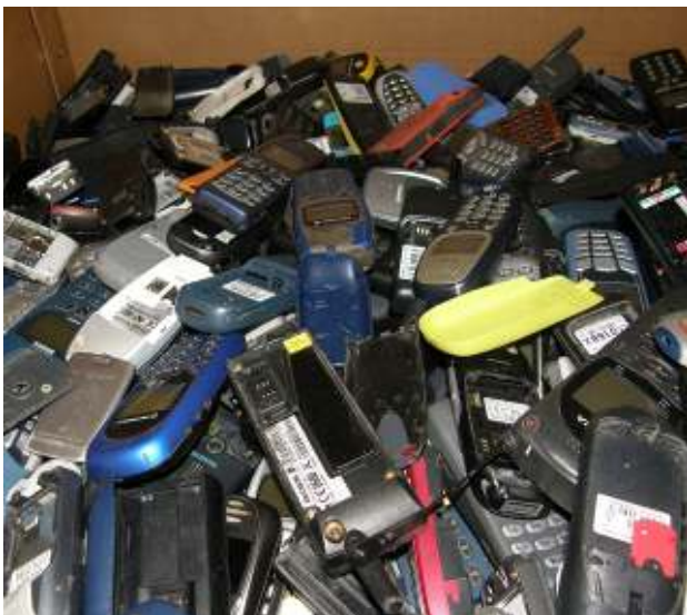
Gemischte Althandys ohne und mit Akkus, nicht getestet – Abfall/gefährlicher Abfall

Mixed waste mobile phones without and with batteries, not tested – waste/hazardous waste