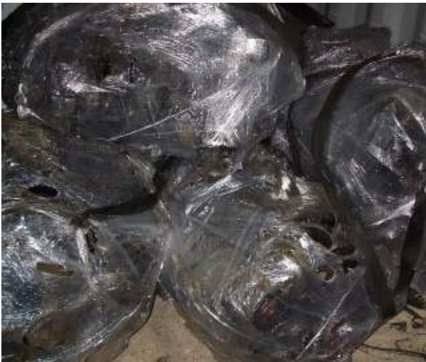
Folierte Altmotoren, kein Prüfzertifikat der Funktionsfähigkeit - Abfall / gefährlicher Abfall Foiled waste engines without certificate of testing - waste / hazardous waste