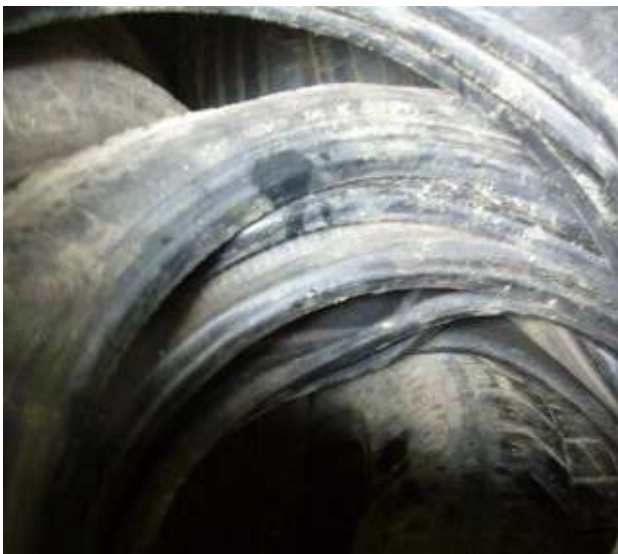
Händisch triplierte, gebrauchte, beschädigte Reifen - Abfall Manually tripled used tires showing damages - waste