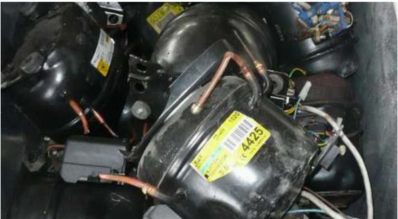
Alte Kompressoren mit unterschiedlichen Kältemitteln, kein Prüfzertifikat, keine Verpackung – gefährlicher Abfall Old compressors containing different types of refrigerants, no certificate of testing, no packaging – hazardous waste