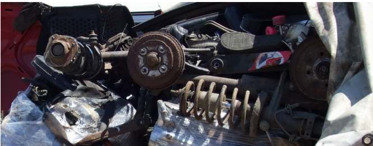
Gemischte alte KFZ-Bauteile - Abfall / gefährlicher Abfall; Mixed old vehicle spare parts - waste / hazardous waste

The components or vehicle spare parts are destined for recovery or disposal (e.g. scrapping, landfilling) and not for reuse.