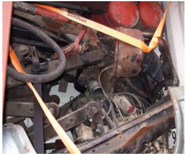
Gemischte alte Karosserie- und Bauteile, dahinter befindet sich ein alter Kleinbus - Abfall / gefährlicher Abfall Mixed old car body panels and components; behind, there is an old minibus - waste / hazardous waste