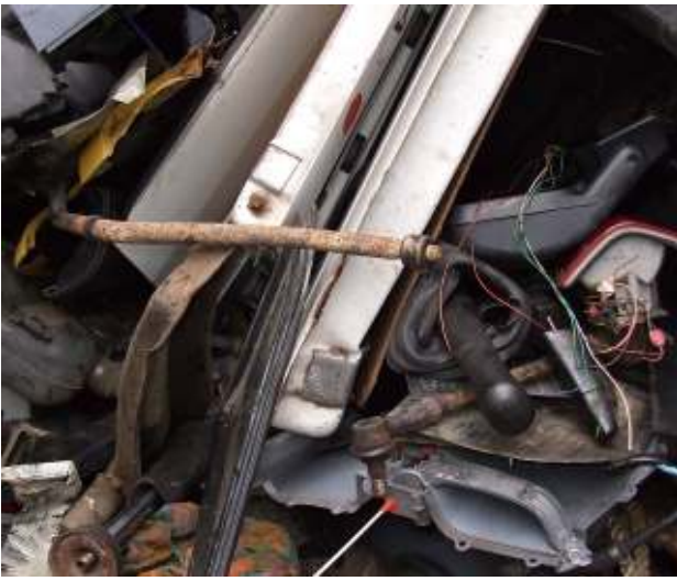
Gemischte alte Karosserieteile - Abfall Mixed old car body panels - waste