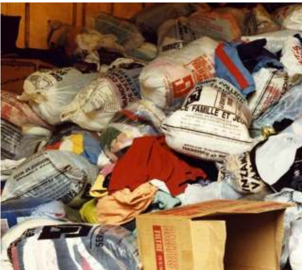
Unsortierte Alttextilien aus der Sammlung - Abfall Unsorted waste textiles from collection systems - waste