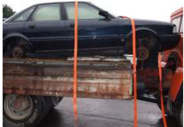
Aufgeladener PKW, dessen Reparaturkosten höher sind als der Fahrzeugwert (auch Ölverluste) - gefährlicher Abfall Loaded car whose repair costs exceed the present value of the vehicle (also oil loss) - hazardous waste.