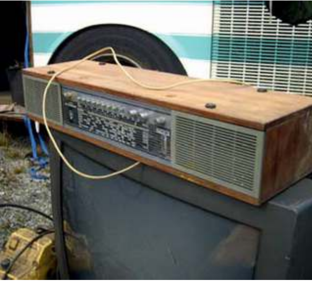
Nicht funktionsfähiges Radio und altes nicht funktionsfähiges Fernsehgerät - Abfall / gefährlicher Abfall Non-functional radio and old, non-functional TV set - waste / hazardous waste