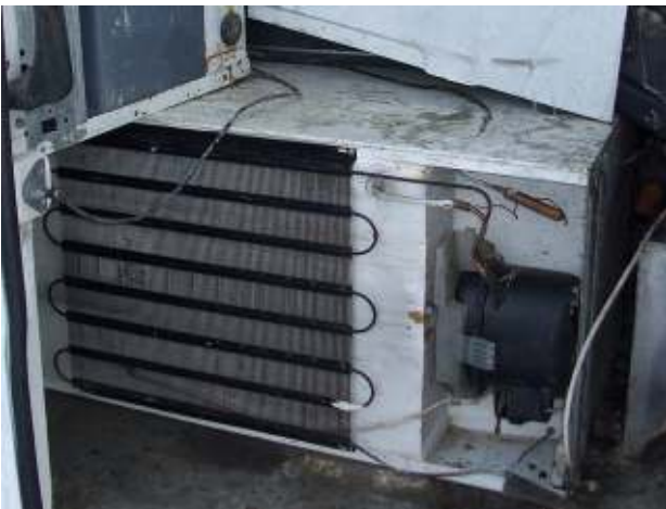
Diverse Altkühlgeräte ohne Ladungssicherung oder Verpackung, ohne Testzertifikat – gefährlicher Abfall Different types of waste refrigerators not securely stapled /no packaging, no certificate of testing – hazardous waste

http://www.bmlfuw.gv.at/umwelt/abfall-ressourcen/abfallverbringung/gruene_liste.html