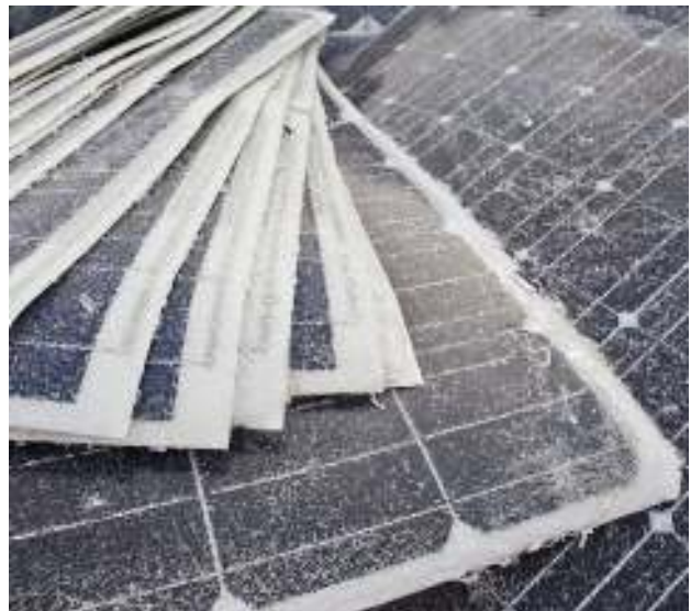
Beschädigte Photovoltaikzellen – Abfall Damaged photovoltaic cells - waste