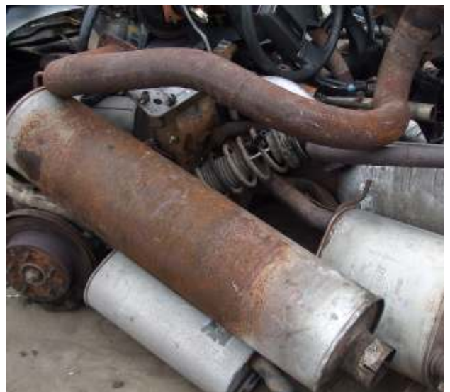
Alte Auspuffe und Katalysatoren - Abfall Old mufflers and catalyts - waste