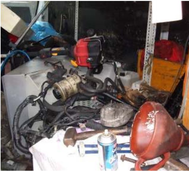
Gemischter Elektronikschrott mit anderen Abfällen - Abfall / gefährlicher Abfall Mixed electronic scrap with other waste - waste / hazardous waste