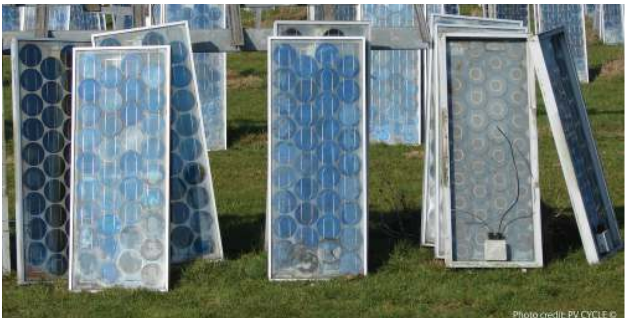
Ausrangierte Photovoltaikzellen – Abfall; End-of-life photovoltaic cells – waste