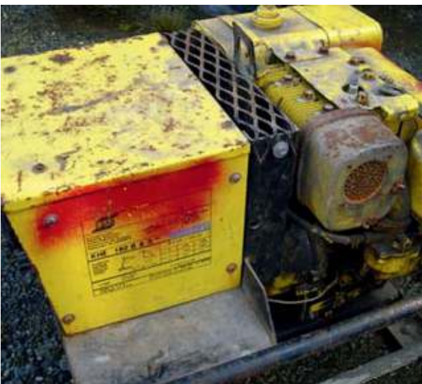
Defekter Hochdruckreiniger - Abfall Defect pressure washer - waste