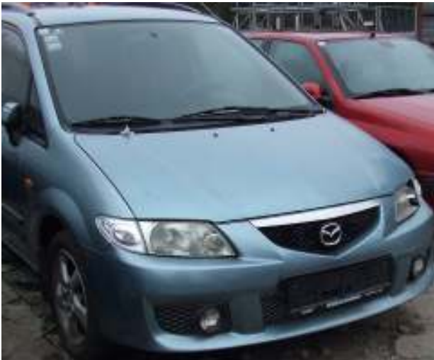
Gebrauchtwagen, funktionstüchtig - Nichtabfall Operational used vehicle – non-waste