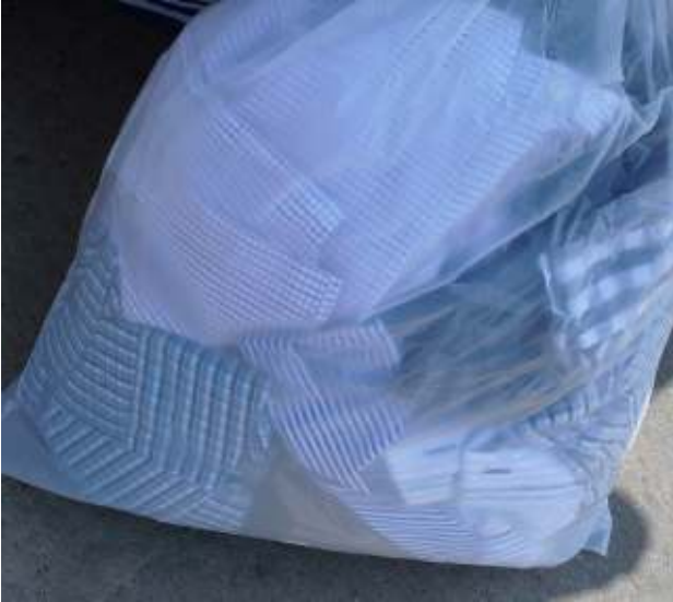
Sortierte gebrauchte Hemden - Nichtabfall Sorted used shirts - non-waste