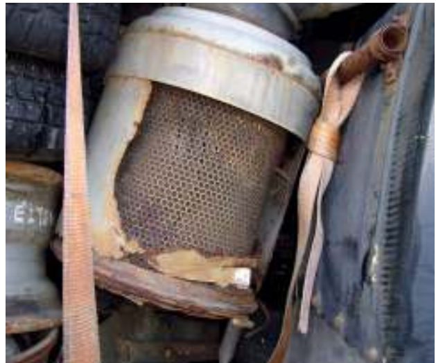
Alter Auspuff und diverse Bauteile sowie Altreifen - Abfall Old muffler and various components as well as waste tires - waste