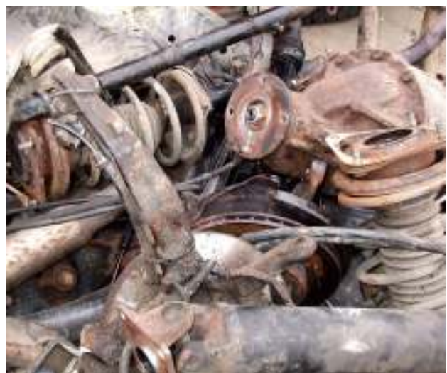
Gemischte alte Bauteile - Abfall Mixed old car components - waste