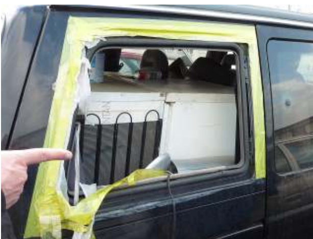
Gebrauchtfahrzeug, das als Container für den Transport von Abfällen /gefährlichen Abfällen verwendet wird - gefährlicher Abfall Used vehicle, which serves as container for the transport of wastes/hazardous waste - hazardous waste