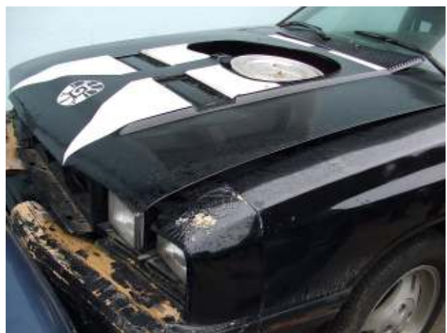
Altfahrzeug, Motorraum stark korrodiert durch Regenwasserzutritt - gefährlicher Abfall End-of-life vehicle, engine compartment heavily corroded due to rain water - hazardous waste