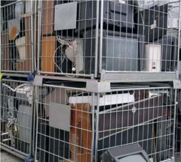
Defekte TV-Geräte und Monitore aus der EAG-Sammlung - gefährliche Abfälle Defect TV sets and monitors from WEEE collection - hazardous waste