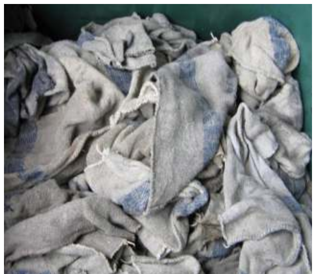
Ölverunreinigte Putzlappen - gefährlicher Abfall Oil-contaminated rags - hazardous waste