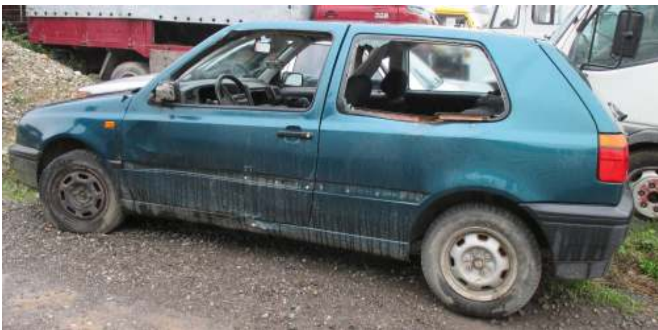
Teilausgeschlachtetes Altfahrzeug – gefährlicher Abfall; Partially dismantled end-of-life vehicle – hazardous waste

Thus not only for the determination of the present market value of the vehicle and the repair expenses the country where the used or end-of life vehicle is located at the time of the determination of these factors is of relevance, but it is generally necessary to assess the compliance with national technical regulations in Austria.