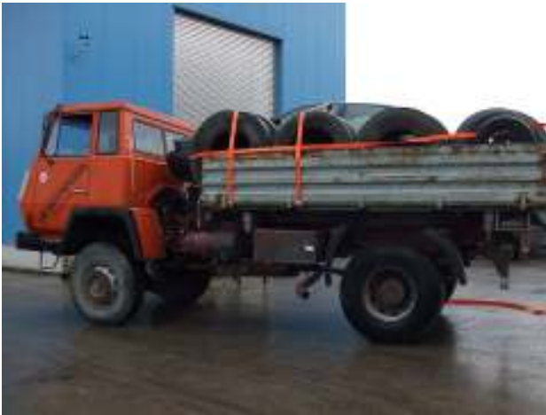
Stark korrodierter LKW, dessen Reparaturkosten höher sind als der Fahrzeugwert (auch Ölverluste) - gefährlicher Abfall Heavily corroded truck whose repair costs exceed the present value of the vehicle (also oil loss) - hazardous waste.