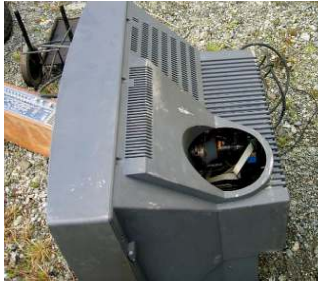
Nicht funktionsfähiges Fernsehgerät - gefährlicher Abfall Non-functional TV set - hazardous waste