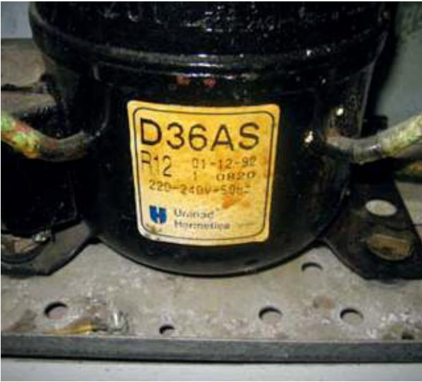
Kompressor, welcher das verbotene FCKW R12 (Dichlorodifluormethan, Freon 12) enthält - gefährlicher Abfall Compressor containing the prohibited CFC R12 (dichlorodifluoromethane, Freon 12) - hazardous waste