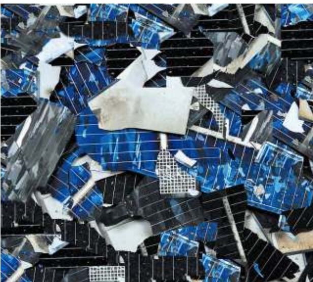
Zerbrochene Photovoltaikzellen – Abfall Broken photovoltaic cells - waste