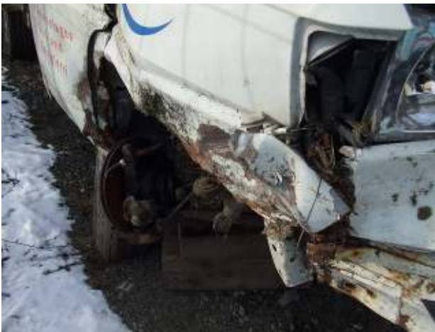
Altfahrzeug mit gebrochener Achse - gefährlicher Abfall End-of-life vehicle with broken axle - hazardous waste