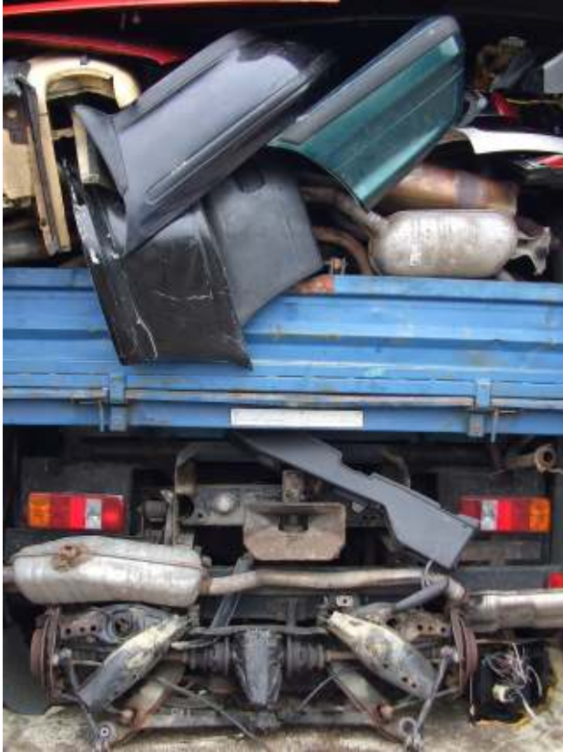
Gemischte alte Karosserieteile - Abfall Mixed old car body panels - waste

Beispiele für sogenannte Ersatzteile, die jedoch als Abfall einzustufen sind (korrodiert, Transport als Schüttgut, keine Verpackung, keine Transport- oder Ladeliste, keine Testzertifikate).