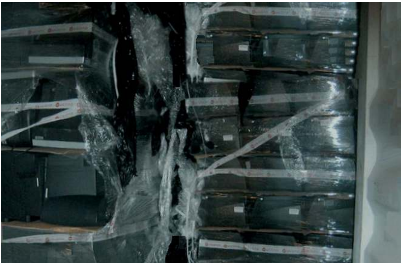
Ausreichende Verpackung und Vorlage eines Nachweises der Funktionsfähigkeit sind essentiell für die Klassifikation als Nichtabfall Sufficient packaging and certificate of testing are essential elements for the classification as non-waste