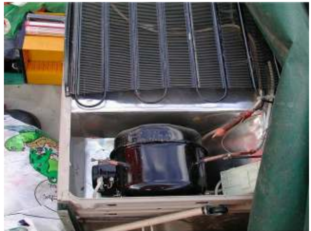
Nicht funktionierendes Altkühlgerät – gefährlicher Abfall Non-functional waste refrigerator - hazardous waste