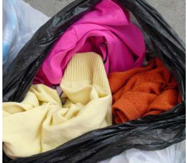
Sortierte Altkleider - Nichtabfall Sorted used textiles - non-waste