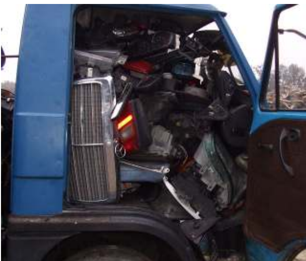
Gemischte alte Karosserie- und Bauteile - Abfall Mixed old car body panels and components - waste