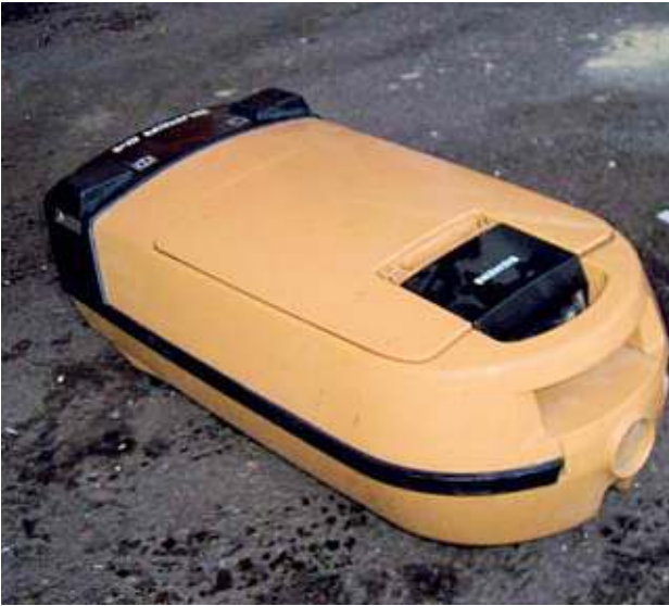
Gebrauchter Staubsauger mit fehlendem Schlauch - Abfall Used vacuum cleaner without hose - waste