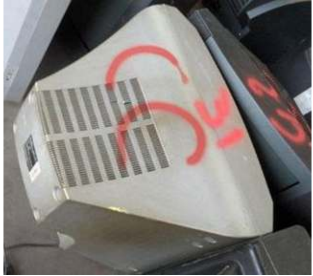
Gebrauchte Monitore mit abgeschnittenen Netzkabeln, kein Prüfzertifikat der Testung - gefährlicher Abfall Used monitors, power cables cut-off, no certificate of testing - hazardous waste