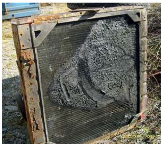
Defekter Radiator (nach Brand) - Abfall Fire-damaged radiator - waste