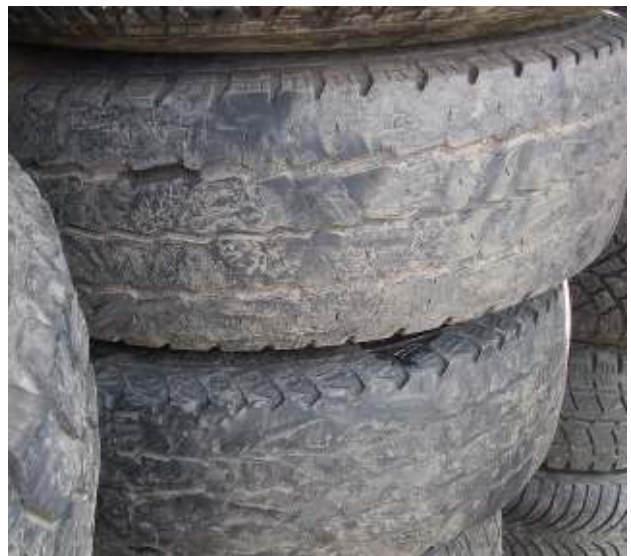
Altreifen ohne die erforderliche Profiltiefe für die Wiederverwendung - Abfall Waste tires with insufficient tread depth for reuse - waste