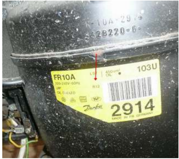
Kompressor, welcher das verbotene FCKW R12 (Dichlorodifluormethan, Freon 12) enthält - gefährlicher Abfall Compressor containing the prohibited CFC R12 (dichlorodifluoromethane, Freon 12) - hazardous waste