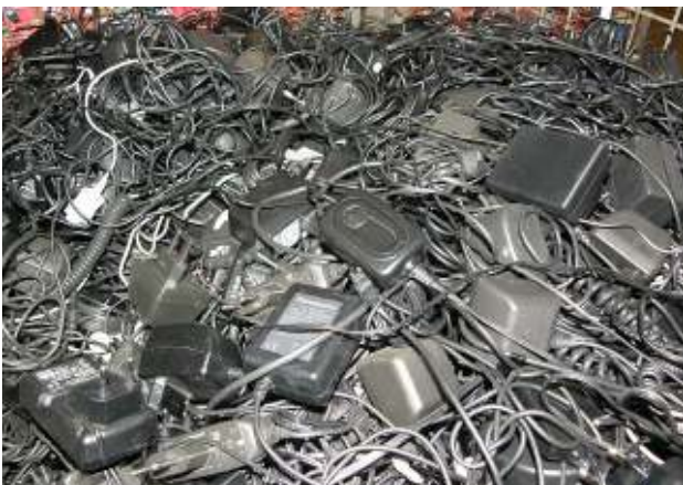
Gebrauchte Handy-Ladegeräte (nicht getestet) - Abfall Used mobile phone chargers (untested) - waste