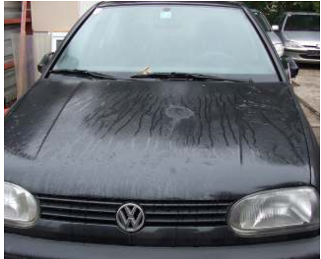
Gebrauchtwagen, funktionstüchtig - Nichtabfall Operational used vehicle – non-waste