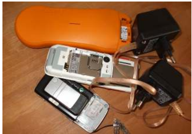
Gebrauchte Handys (nicht getestet) ohne Akkus - Abfall Used mobile phone (untested) without batteries - waste