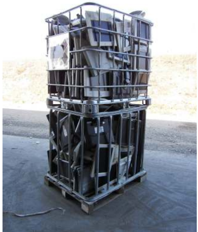
Defekte LCD Bildschirme aus der EAG-Sammlung - gefährliche Abfälle Defect LCD screens from WEEE collection - hazardous waste