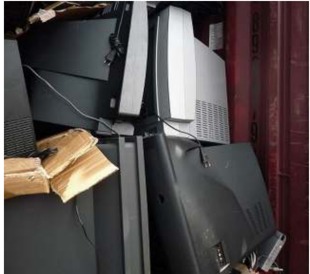
Gebrauchte Bildschirmgeräte mit unzureichender Verpackung, kein Prüfzertifikat der Testung - gefährliche Abfälle Used visible display units with insufficient packaging, no certificate of testing - hazardous waste