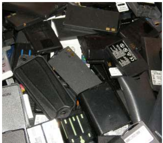
Gebrauchte Akkumulatoren, Ladekapazität unter 40% - gefährlicher Abfall

Used batteries, charging capacity below 40% - hazardous waste