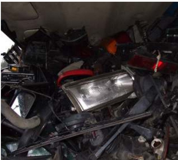
Gemischte alte Karosserie- und Bauteile - Abfall Mixed old car body panels and components - waste