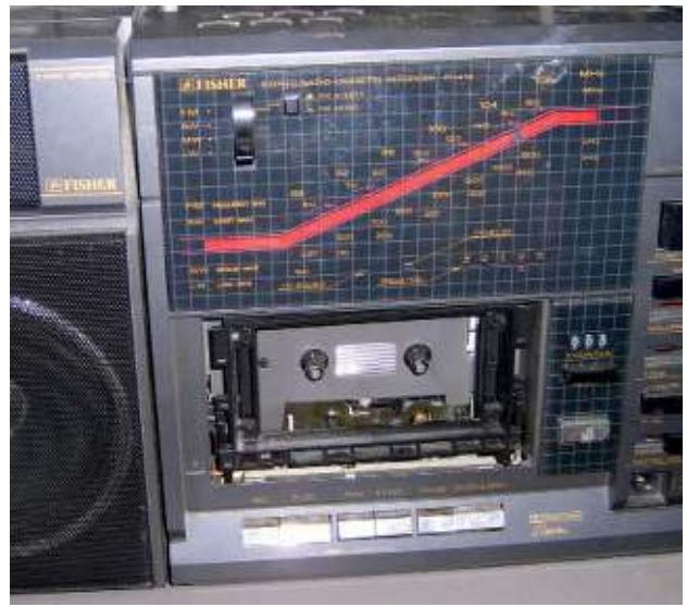
Der Kassettenhalter fehlt bei diesem alten Recorder, Kassetten lassen sich nicht abspielen - Abfall The cassette holder is missing on this old recorder, the cassettes cannot be played - waste